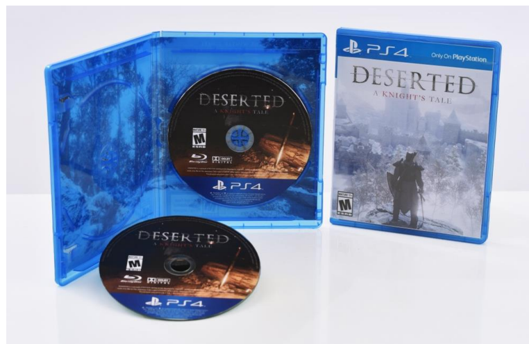
Ví dụ về các file thiết kế từng sản phẩm (Media)