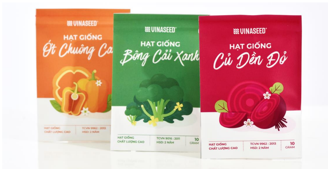
Ví dụ về các file thiết kế từng sản phẩm